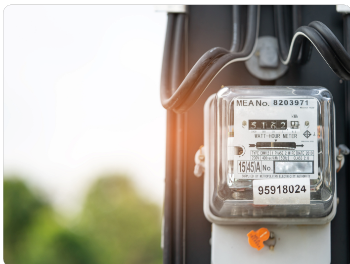
Villanyóra fotók(mérőóra gyártási szám, kismegszakítók, távoli kép)